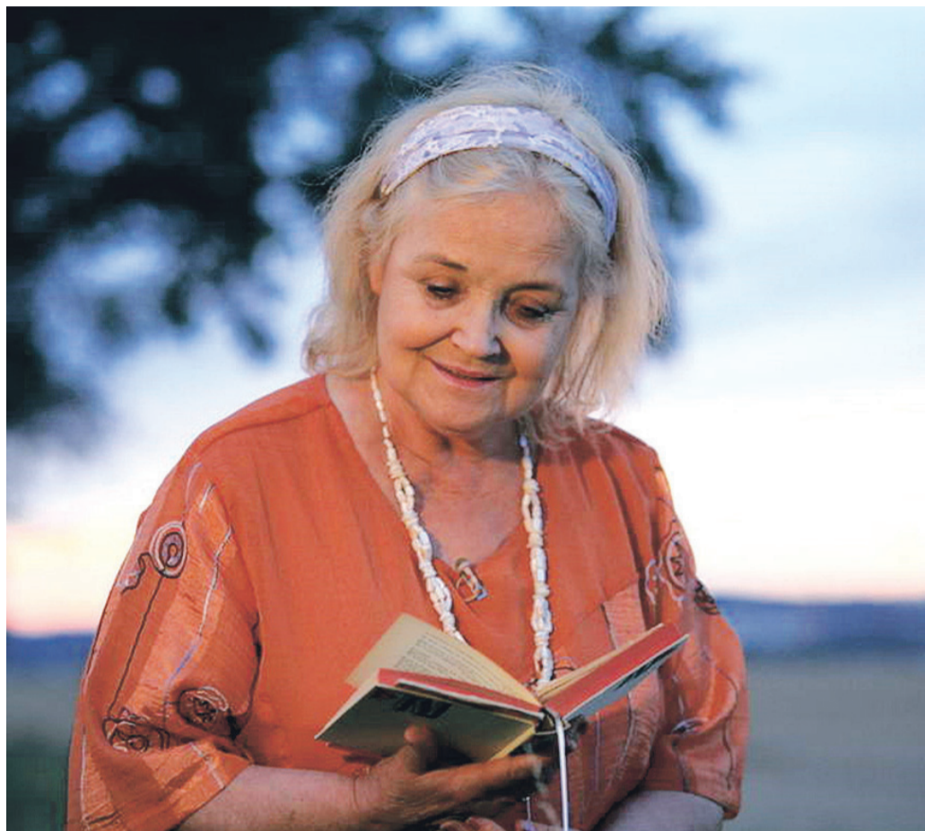
KRÁLOVSTVÍ POEZIE. Herečku Gabrielu Vránovou (na snímku) a fotografa a režiséra Ondřeje Kepku přivítají v sobotu 7. srpna v Letní minigalerii ve Třech Studních. Gabriela Vránová představí své nově vydané DVD Království poezie, které režíroval právě Ondřej Kepka.